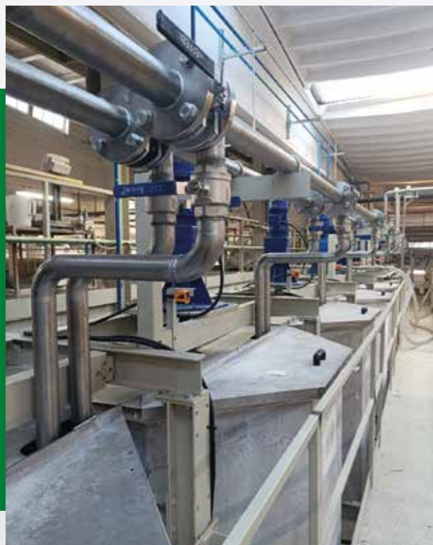
Prelievo smalto/engobbo • Picking of glaze/engobe • Retirada de esmalte/engobe • Prélèvement d'émail/engobe • Colheita de esmalte/engobo.