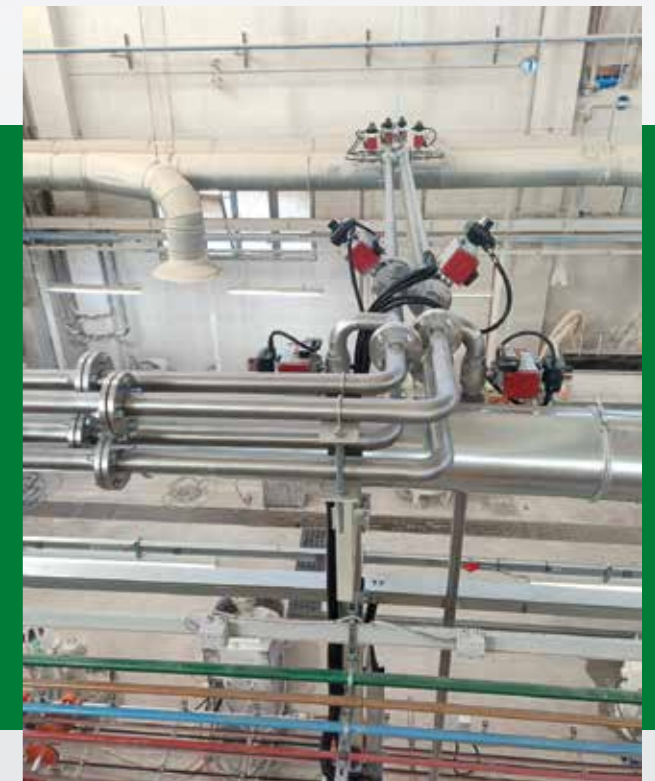
Valvole di scarico • Discharge valves • Válvulas de descarga • Vannes de déchargement • Válvulas de descarga.