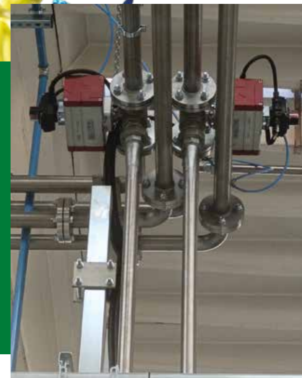
Valvole di scarico • Discharge valves • Válvulas de descarga • Vannes de déchargement • Válvulas de descarga.