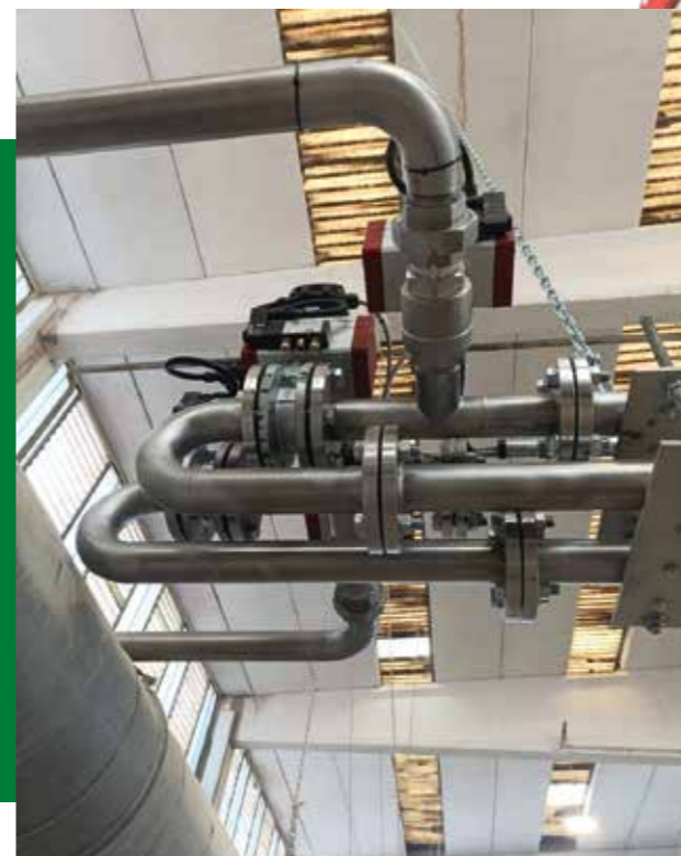
Dettaglio ricircolo • Recirculation detail • Detalle recirculación • Détail recirculation • Tiragem recirculação.