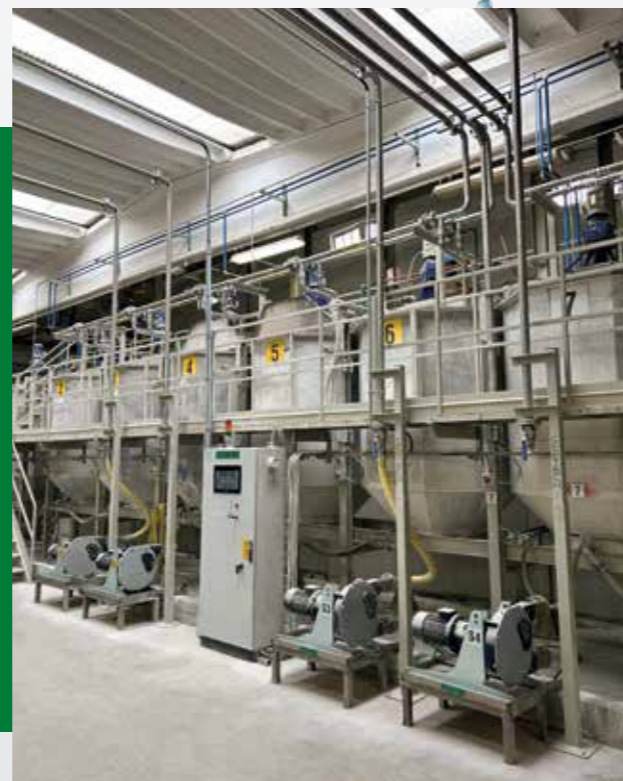
Sistema di pompaggio e gestione • Pumping and management system • Sistema de bombeo y gestión • Système de pompage et de gestion • Sistema de bombeamento e gestão.